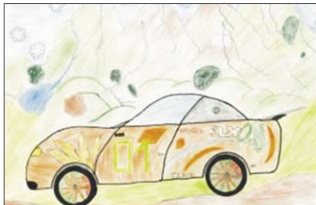
4. miesto – Radovan Forgáč