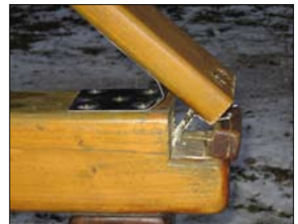
Poškodený koník v parku.

tam niekto dokazoval svoju silu. Taktiež ozdobné kríky a výsadba v parku si zaslúžia šetrnejšie zaobchádzanie. Vozenie sa na bicykloch alebo naháňanie sa cez tieto dreviny im určite na krásu nepridá, nehovoriac o tom, že mnohé z kríkov sú olámané až pri zemi. Verím, že rodičia napomenú deti a vysvetlia im, že aj vonku v parku sa treba chovať tak, aby nikomu neublížovali a nič neničili, za čo im vopred ďakujem.